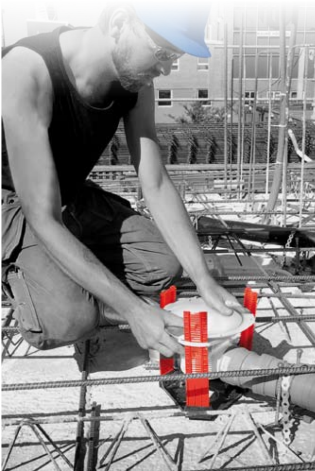
Eksempel på montering av sluk i prefabrikkert betongelement med JAFØ Innstøpningsstativ