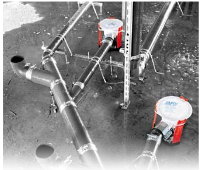
Eksempel på montering av sluk i betongbjelkelag med JAFØ Innstøpningsstativ